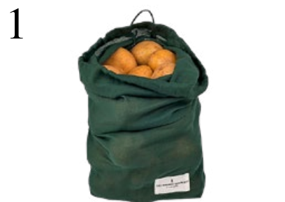
1 KARTOFFELSACK RELOADED Essens-Beutel von The Organic Company aus Bio-Baumwolle. In diversen Grössen erhältlich. Z. B. bei www.rrevolve.ch , ab CHF 6.–

Weniger Abfall produzieren, auf langlebige Produkte setzen, recyceln, Klassiker statt Fast Fashion kaufen: Das gibt ein gutes Gefühl und hilft der Umwelt. Redaktion: Barbara Halter