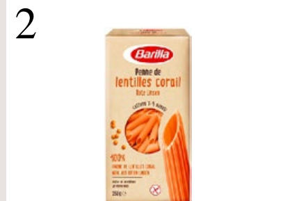
2 PASTA AUS HÜLSENFRÜCHTEN Penne aus roten Linsen von Barilla. Glutenfrei, reich an Ballaststoffen und Protein. Bei Coop, 250 g CHF 3.95