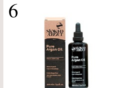
6 NATÜRLICHES MULTITALENT Kalt gepresstes Argan-Öl macht die Haut elastisch und hilft bei trockenen Haarspitzen. www.stokedabout.com , ab CHF 14.–