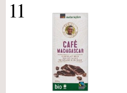
11 EDELKAKAO AUS MADAGASKAR Kakao anbauen statt Regenwald roden: Von der Schokolade Café Madagaskar profitieren Mensch, Tier und Natur. Bei Coop CHF 2.70