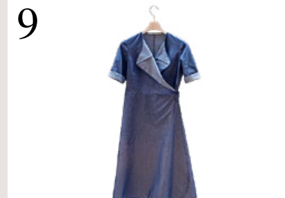
9 LEICHTIGKEIT Wickelkleid aus reiner, wie Papier anmutender Baumwolle. In Zürich designt, im Tessin genäht. www.paradisdesinnocents.ch CHF 489.–