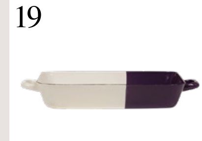
19 OBERS UND ZWETSCHKE Back- und Bratform aus Emaille aus der Edition Sarah Wiener von Riess. Gesehen bei www.einzigart.ch CHF 59.–