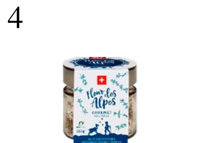
4 SALZ MIT KRÄUTERN Schmeckt fein über ein weiches Ei gestreut: Salz Fleur des Alpes mit Schweizer Bio-Thymian. Bei Migros, 110 g CHF 8.50