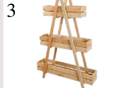
3 DEN BALKON BEGRÜNEN Pflanzengestell mit drei Etagen, aus FSC-zertifiziertem Kiefernholz. Höhe 147, Länge 103 cm. Bei Do it+Garden Migros CHF 169.–