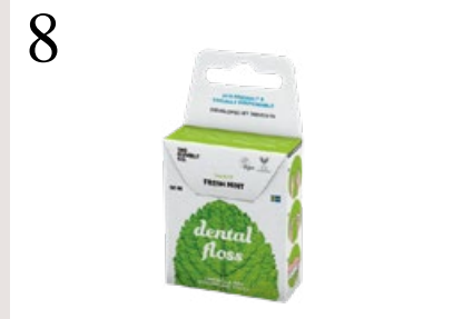
8 ABFALL REDUZIEREN Die Kartonbox der Zahnseide von The Humble Co. dient zugleich als Spender. Bei Müller Drogeriemarkt und im Fachhandel CHF 6.50