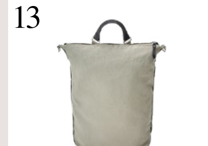
13 VIELSEITIG NUTZBAR Roll Pack aus Bananatex, die Grösse der Tasche und die Tragriemen sind verstellbar, mit Seitenzugriff. www.qwstion.com CHF 340.–