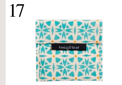
17 BAUMWOLLE STATT PLASTIK Sandwich-Beutel aus Baumwolle mit einem wasserdichten Innenstoff. Waschbar. Von www.undenker.ch CHF 8.–