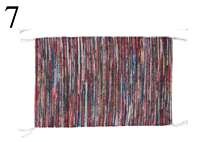
7 MACHT SICH GUT IM BAD Der Teppich Tänum wird aus Stoffresten aus der Bettwäsche-Produktion gefertigt. Bei Ikea, 90x60 cm CHF 4.95