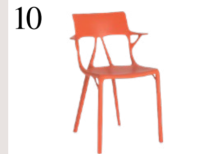
10 RAUSSTUHLN ERLAUBT Der Stuhl A.I. besteht zu hundert Prozent aus recyceltem Kunststoff. Wetterfest, in verschiedenen Farben. www.kartell.com CHF 238.–