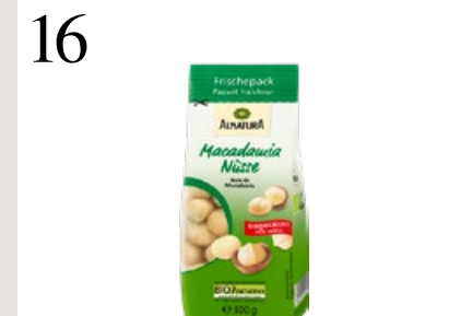
16 DIE KÖNIGIN DER NÜSSE Ungesalzene Macadamia-Nüsse eignen sich zum Kochen und Backen. Zum Beispiel für Brownies. Bei Alnatura, 100 g CHF 5.60