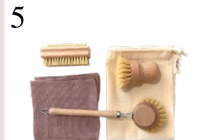
5 ZERO WASTE IN DER KÜCHE Küchenset: ein Spüllappen (Farbe variiert), Abwaschbürsteli aus Holz, Handbürste und Topfbürste. www.ecocult.ch CHF 35.–