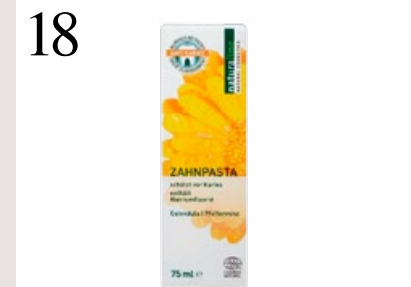
18 SANFTE REINIGUNG Zahnpasta mit Bio-Kamille und -Myrrhe für empfindliches Zahnfleisch. Enthält Natrium-florid. Von Coop Naturaline CHF 5.95