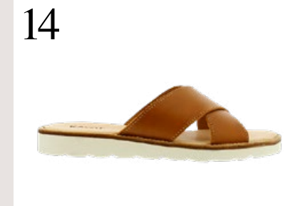
14 HÄLT MEHRERE SAISONS Sandale Axamo von Kavats, aus umweltfreundlich und chromfrei verarbeitetem Leder, diverse Farben. www.kavat.com CHF 100.–